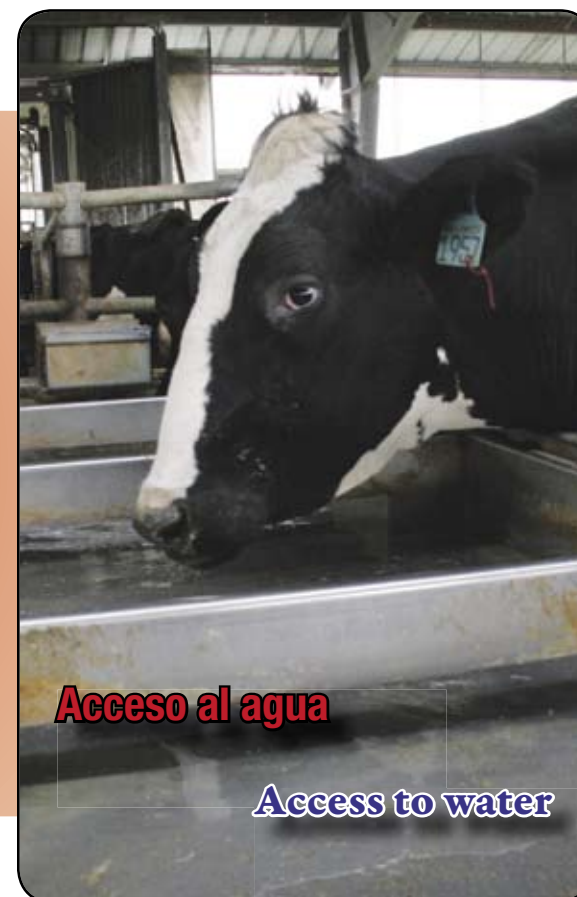
Acceso al agua