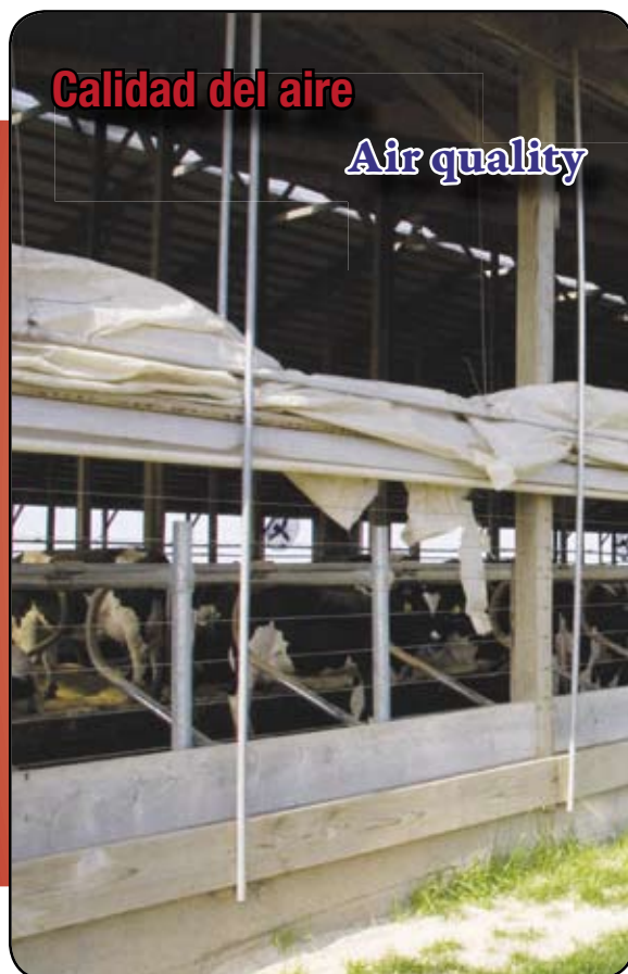
Calidad del aire